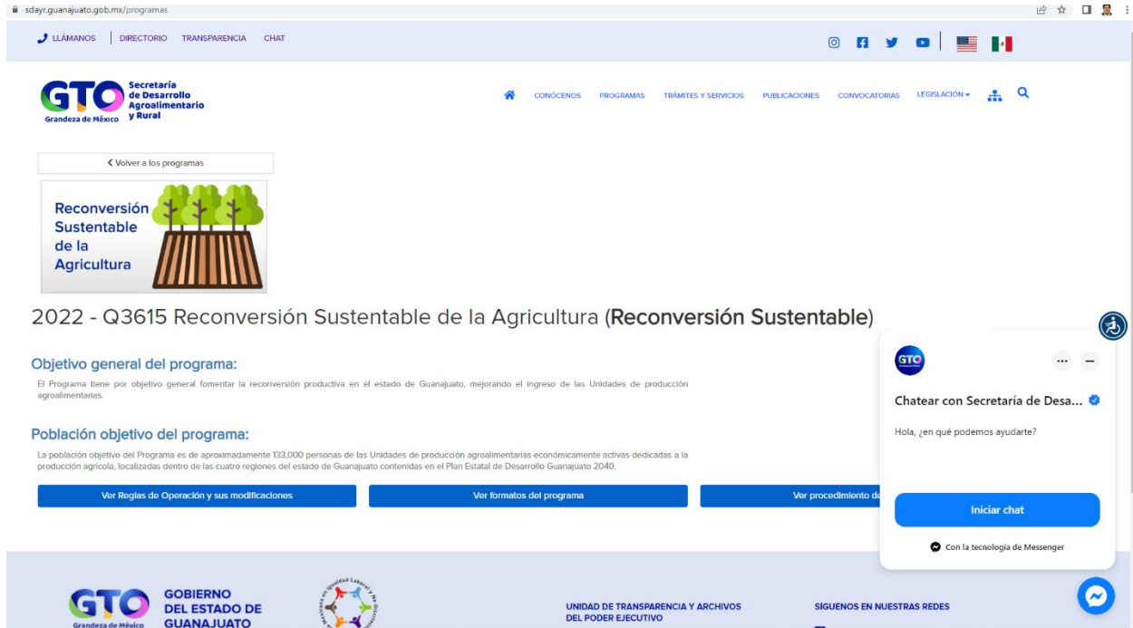
Figura 1. Evidencia de la difusión en la página de la SDAyR de las ROP y sus formatos

la figura 1, por lo que se concluye que están disponibles para la población objetivo y están apegados a su documento normativo.