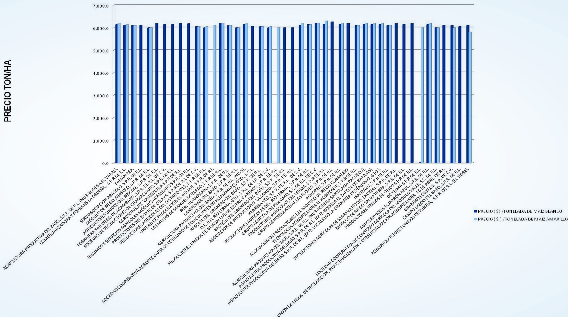
MAÍZ BLANCO Y MAÍZ AMARILLO PV-2021 EN GUANAJUATO.

INFORMACIÓN DE LOS CENTROS DE ACOPIO DE GTO.