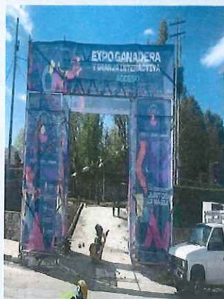
Difusión de los municipios