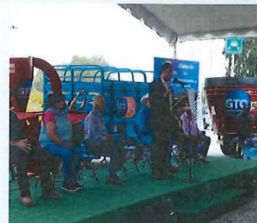
Entregas de apoyos a las unidades de producción