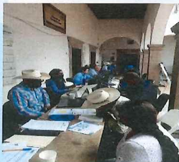
Ventanillas de atención