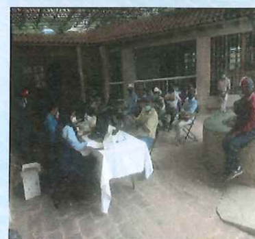
Ventanilla Fisca en Gto