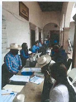
Ventanillas de atención