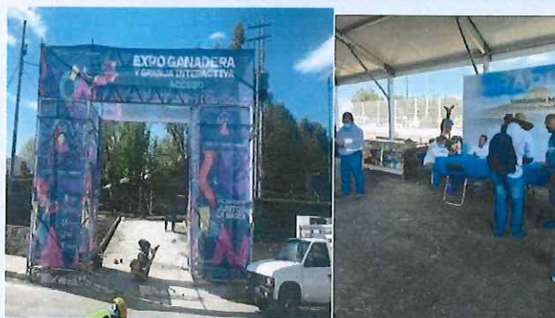
Difusión de los municipios